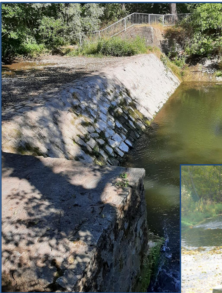
Wehrkörper Istzustand