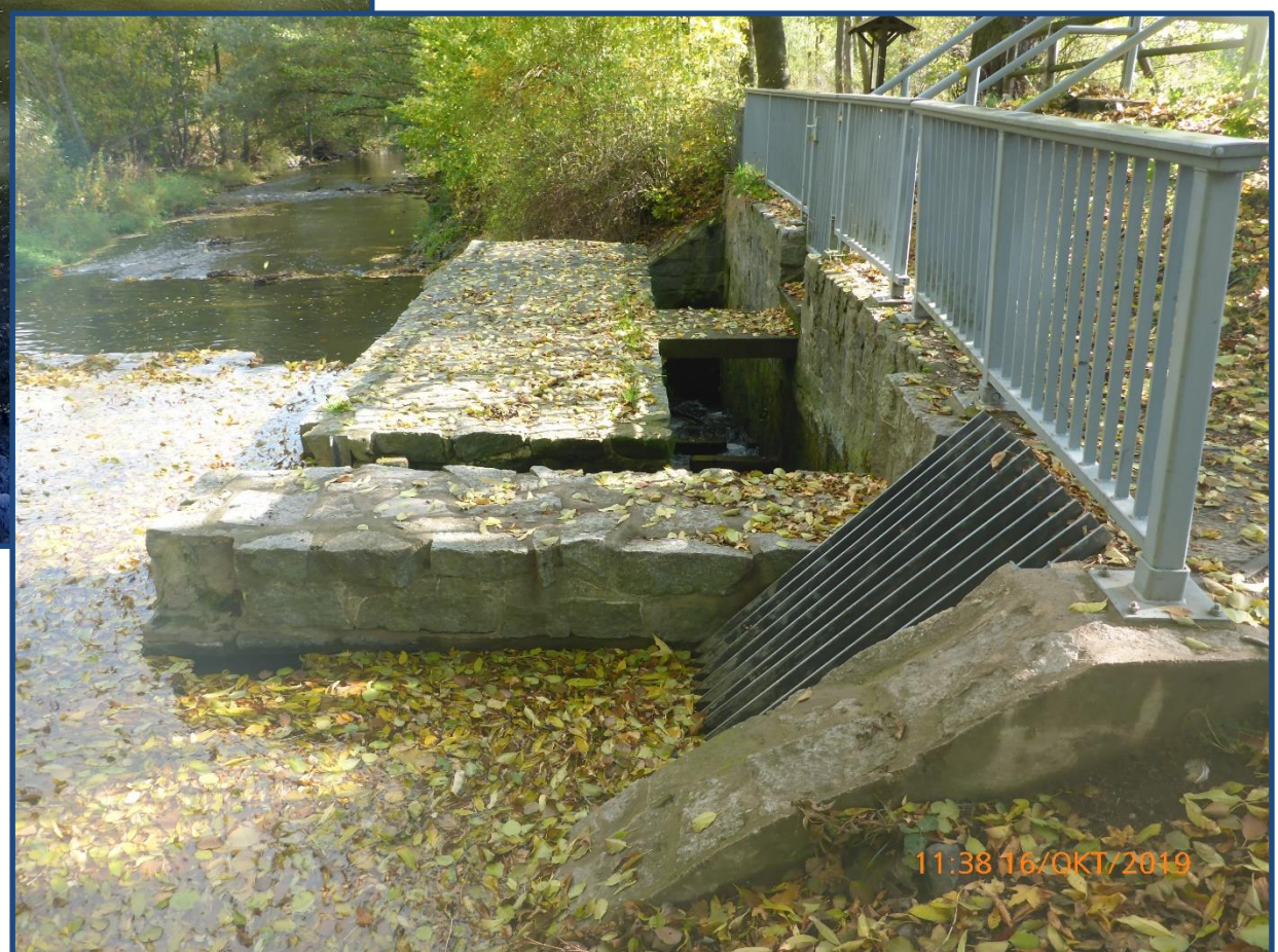
Fischaufstieg Istzustand

Im Zuge der Umsetzung des Landesprogrammes Gewässerschutz 2021 – 2027 sollen zahlreiche Maßnahmen zur Herstellung der Durchgängigkeit des Gewässers und zur Verbesserung der strukturellen Ausstattung bis 2027 umgesetzt werden.