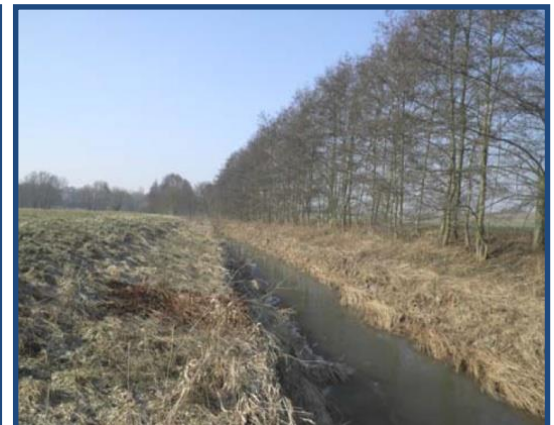
Das Bearbeitungsgebiet des Maßnahmenkomplexes MK4 befindet sich im Landkreis Nordhausen und erstreckt sich von unterhalb der Ortslage Putzlingen bis zur Ortslage Schiedungen.

Zur Erreichung eines guten ökologischen Zustands der Helme ist geplant, dem Gewässer durch eine abschnittsweise Aufweitung mehr Raum und die Möglichkeit zur eigendynamischen Entwicklung von vielfältigen Strukturen zu geben. Durch die Verbreiterung des Gewässerrandstreifens soll in Verbindung mit einer standortgerechten Gehölz- und Strauchstruktur der Austritt des Wassers und der Abfluss auf den angrenzenden Flächen langsamer erfolgen, um damit die hochwasserbedingte Erosion von Böden zu vermeiden.