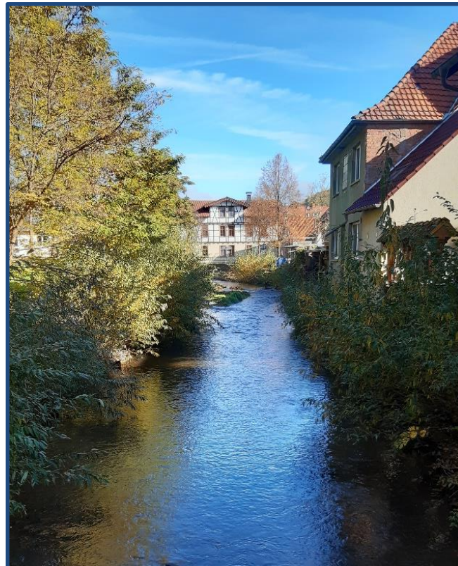
ausgebauter Verlauf im Abschnitt 8

Ziel der Maßnahme sind strukturverbessernde Maßnahmen in den Abschnitten 3 bis 11 sowie die Herstellung der linearen Durchgängigkeit an 13 Querbauwerken in den Abschnitten 4 bis 11 der Schmalkalde. Die Maßnahmen verteilen sich auf ca. 10 km Gewässerlänge beginnend oberhalb der OL Niederschmalkalden bis zur OL Reichenbach. Dies entspricht den LAWA-Maßnahmentypen 69, 71, 72, 73. Die gegenständlichen Leistungen umfassen die Erstellung einer Machbarkeitsstudie sowie die Planung der Leistungsphasen 1 (Grundlagenermittlung) bis 4 (Genehmigungsplanung).