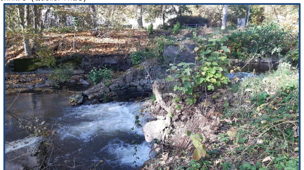
Schützenwehr-Sohlabsturz Reichenbach

Ziel der Maßnahme sind strukturverbessernde Maßnahmen in den Abschnitten 3 bis 11 sowie die Herstellung der linearen Durchgängigkeit an 13 Querbauwerken in den Abschnitten 4 bis 11 der Schmalkalde. Die Maßnahmen verteilen sich auf ca. 10 km Gewässerlänge beginnend oberhalb der OL Niederschmalkalden bis zur OL Reichenbach. Dies entspricht den LAWA-Maßnahmentypen 69, 71, 72, 73. Die gegenständlichen Leistungen umfassen die Erstellung einer Machbarkeitsstudie sowie die Planung der Leistungsphasen 1 (Grundlagenermittlung) bis 4 (Genehmigungsplanung).