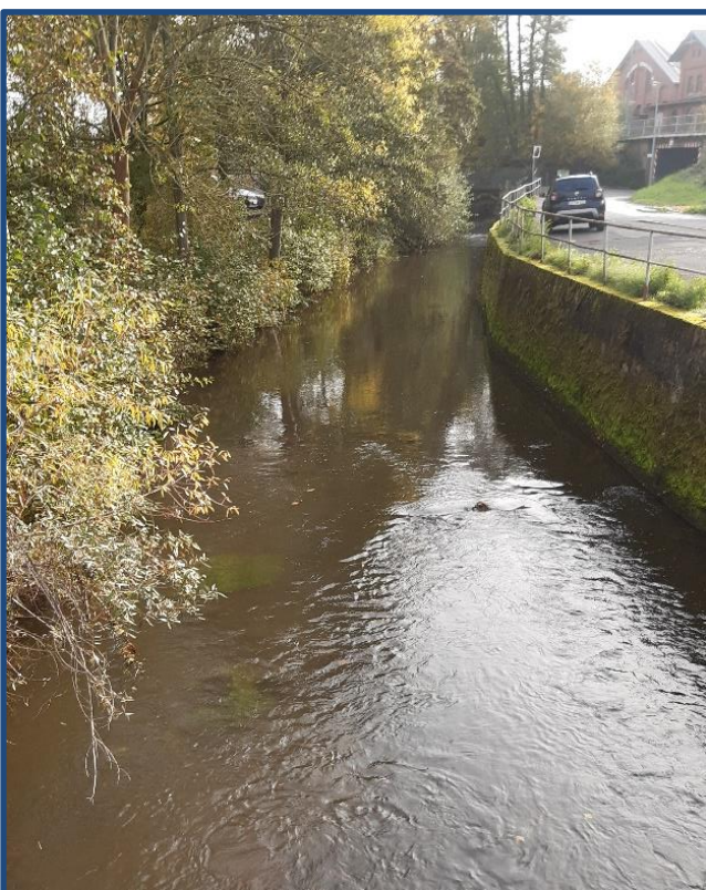
ausgebauter Verlauf im Abschnitt 6

Im Rahmen der Zustandsbewertung zur Umsetzung der EG-WRRL wurde festgestellt, dass der erforderliche Zielzustand im Oberflächenwasserkörper Schmalkalde nicht gegeben ist. Neben festgestellten gewässerstrukturellen Defiziten infolge des Ausbaus und der Befestigung der Gewässer wurden insbesondere durch Querbauwerke die Lebensräume für Fische und Makrozoobenthos zerschnitten.