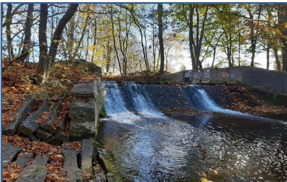
Querbauwerk vor Umbaumaßnahme

Nach Vorgabe der Europäischen Wasserrahmenrichtlinie (EG-WRRL) müssen alle Gewässer einen guten ökologischen Zustand erreichen. Neben festgestellten gewässerstrukturellen Defiziten infolge des Ausbaus und der Befestigung der Gewässer wurden insbesondere durch Querbauwerke die Lebensräume für Fische und Makrozoobenthos zerschnitten. Eine Wanderbewegung genannter Organismen über diese Querbauwerke ist derzeit nur sehr eingeschränkt möglich und muss sowohl flussaufwärts als auch flussabwärts uneingeschränkt ermöglicht werden.