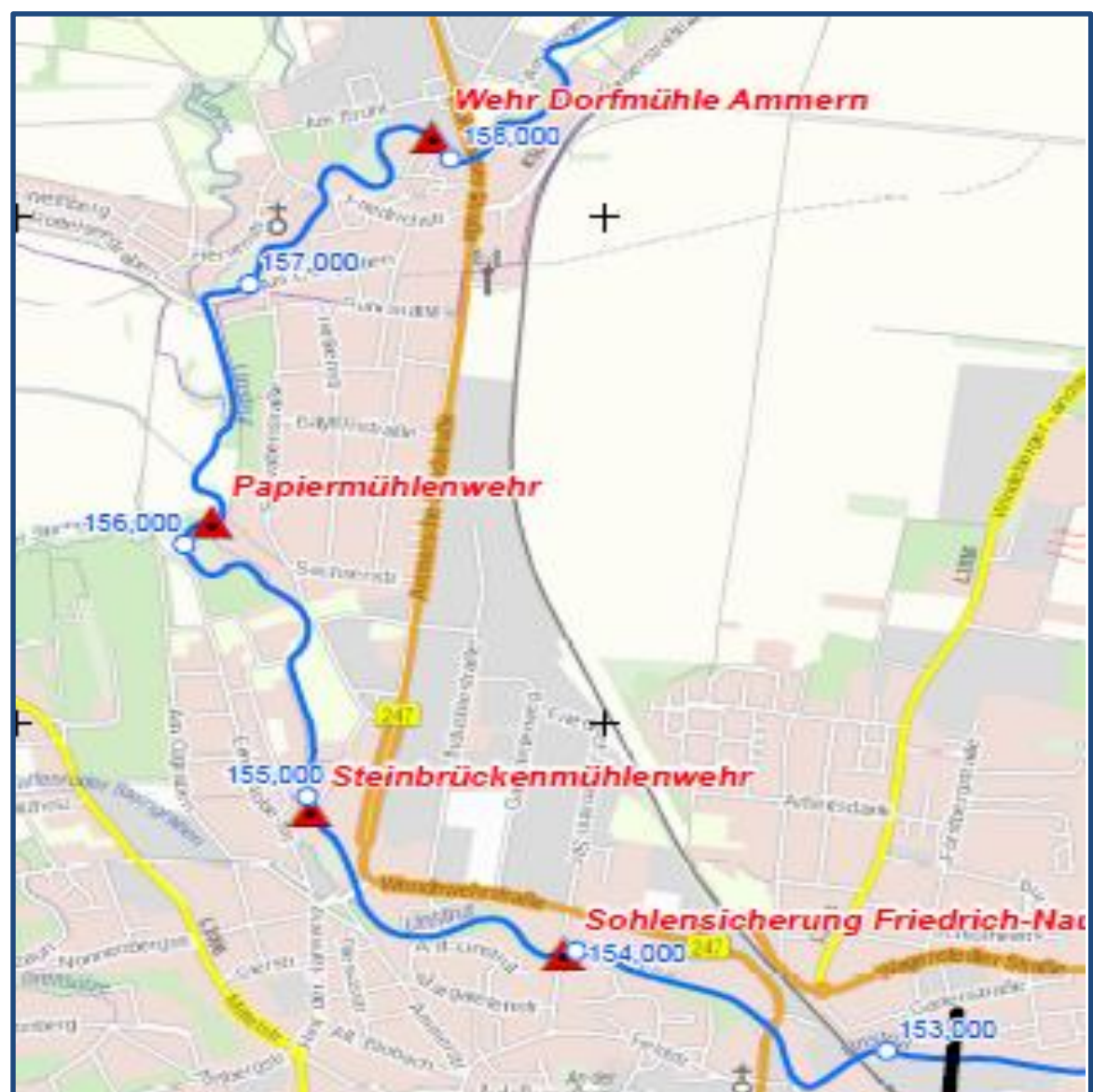
Übersichtskarte zur Machbarkeitsstudie