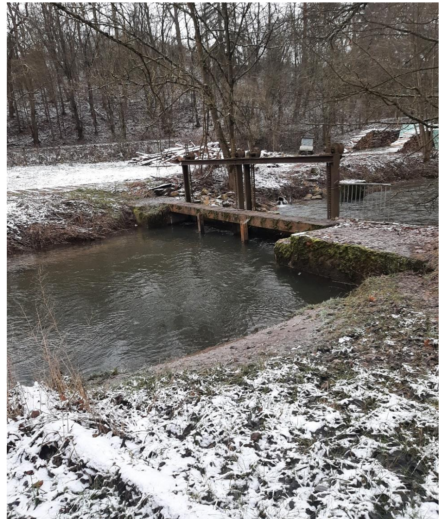
Wehr am Einlauf zum Mühlgraben, 01/2023