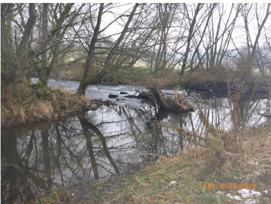
vorhandene Rampe, 2020

Auf der Grundlage der Forderungen der EU-Wasserrahmenrichtlinie soll die vorhandene und nicht funktionstüchtige Sohlgleite in einen Riegel-Beckenpass bestehend aus 9 Riegeln und 8 Becken mit einer Gesamtlänge von 61 m und einem Gefälle von 1:51 umgebaut werden.