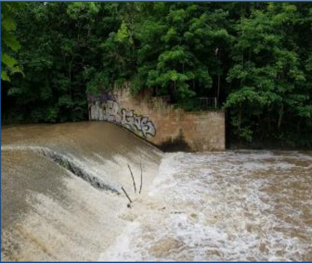
Bild 1: Wehr Nettelbeckufer bei ca. Q(330)

Die Gera ist ein typischer Mittelgebirgsfluss und gilt als der bedeutendste Nebenfluss der Unstrut. Sie entsteht in Plauke durch den Zusammenfluss von Wilder Gera und Zahmer Gera und mündet bei Gebesee in die Unstrut. Für den Hochwasserschutz wurde der Fluss ausgebaut, begradigt und eingedeicht. In seinem Bett sind mehrere Wanderhindernisse errichtet worden, um das Wasser nutzen zu können.