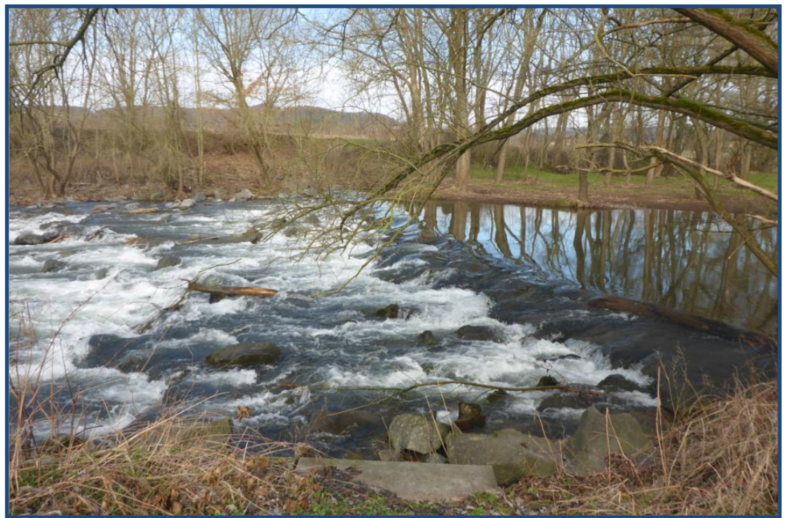
Rampe ehem. Hundeheimwehr, Ist-Zustand

Im Rahmen der Bestandaufnahmen aus den Jahren 2004 und 2013 wurden Defizite zur Erreichung des nach Wasserrahmenrichtlinie angestrebten guten ökologischen Zustands festgestellt. Neben den Defiziten in der Gewässermorphologie wie z.B. das Fehlen von Gewässerstrukturen stellen Querbauwerke erhebliche Wanderhindernisse für die im Fließgewässer lebenden Fische und Makrozoobenthos dar. Somit ist das Erreichen eines guten ökologischen Zustands ohne Rück- und Umbaumaßnahmen zur Herstellung der Durchgängigkeit nicht möglich.